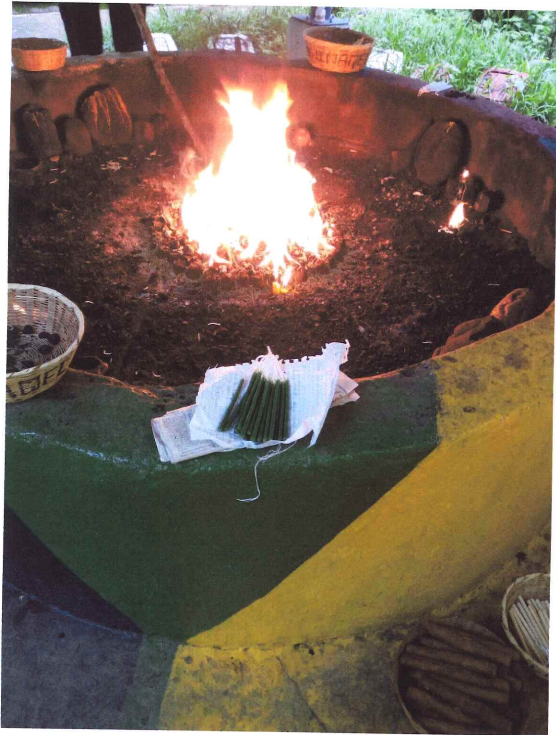
Ceremonia o Toj sobre el fortalecimiento institucional Qawinaqel y ACEM.