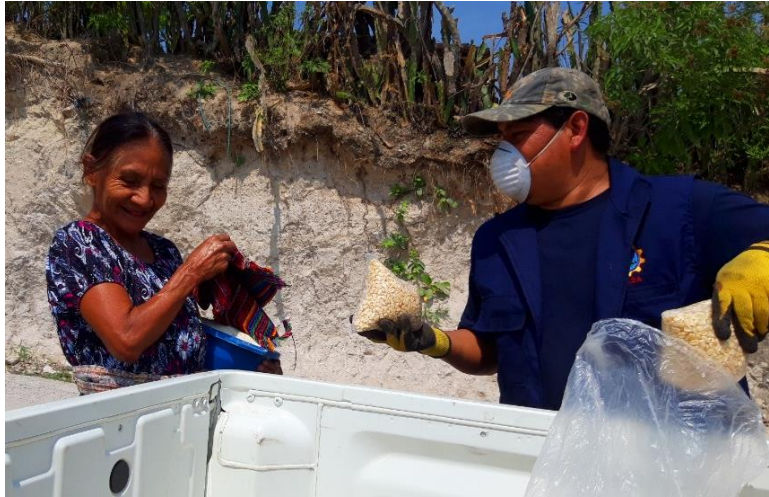
Llevando sonrisas a varias familias.